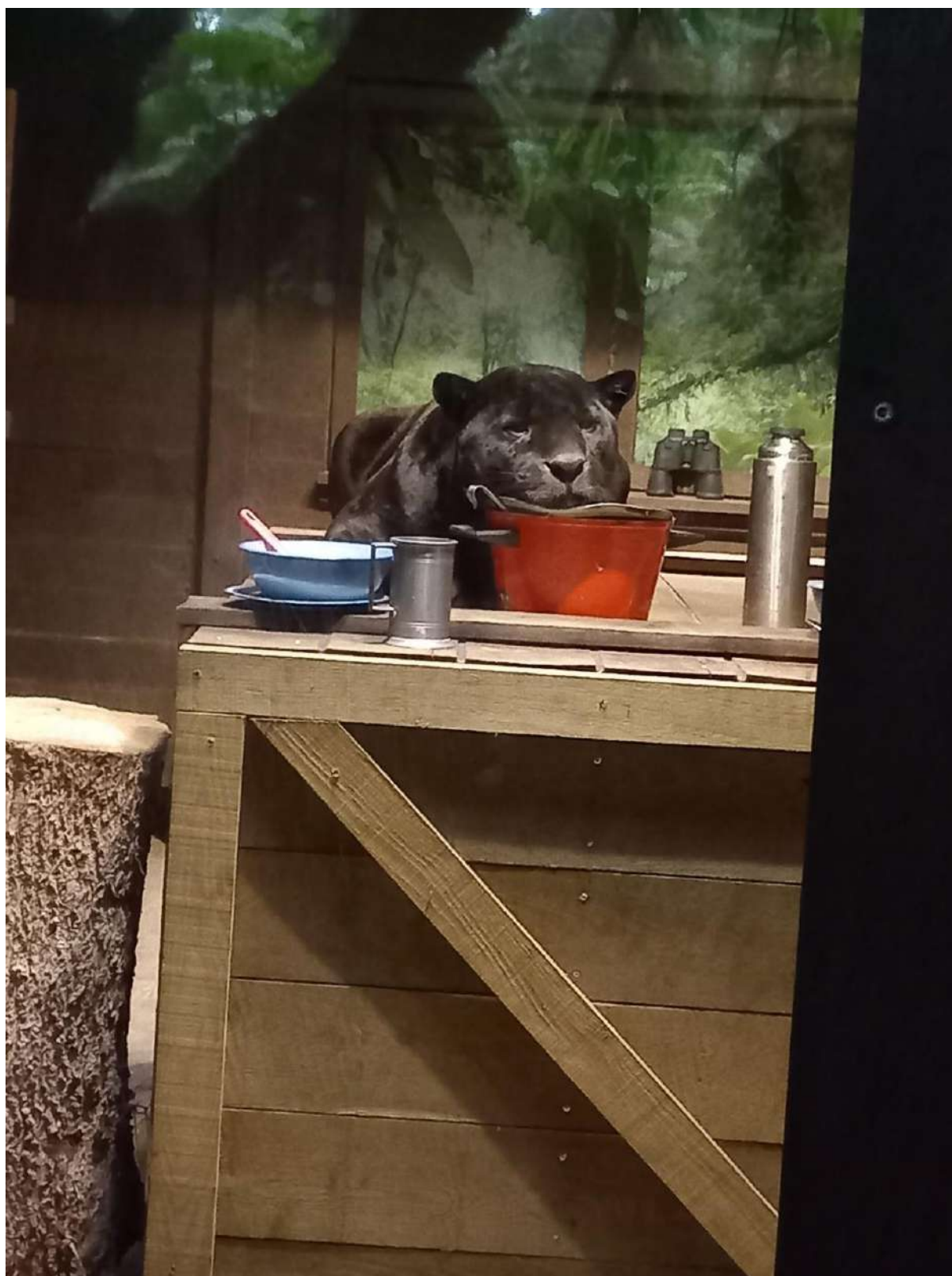
Másik pedig Óváros. Az 1700as évektől az 1900as évekig rengeteg történelmi kiállítást, boltot, házat és ruhákat láthattunk. Rengeteg szuper szuvenírt lehetett venni, a hangulat